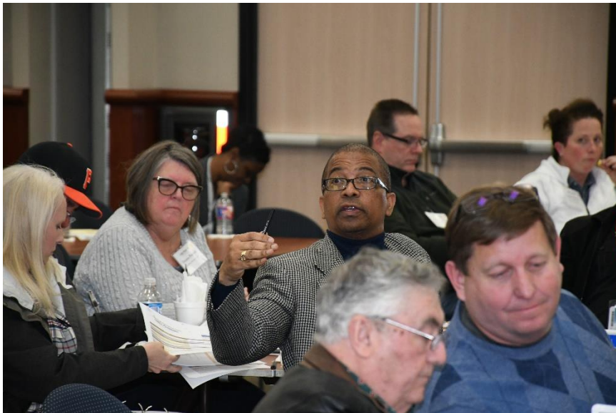
Miembros de la comunidad colaboran durante la reunión del comité de planificación a largo plazo de enero.

Más información acerca de lo que está incluido en el referéndum, así como también la recomendación en detalle presentada a la Junta , están disponibles en la página web del LRPC . Los animo a leer la información para ayudarse a prepararse para hacer un voto informado en mayo.